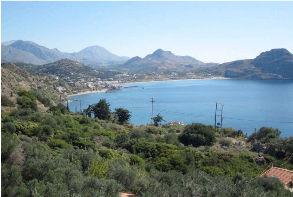
Die Bucht von Plakias in 3 km Entfernung

Der etwas größere Ferienort Plakias ist ca. 3 km entfernt. Auch hier eher beschaulicher Charme, alles sehr gemütlich, keine Ballermann-Atmosphäre. Keine Bettenburgen, alles sehr übersichtlich. Im Ort und am Meer und auch in den umliegenden Bergdörfern gibt es jede Menge Tavernen mit sehr leckerem Essen, gutem Wein, und sehr herzlichen Gastgebern.