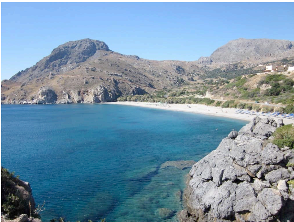
Die Bucht von Souda, direkt unterhalb von Stelios' Pension

Souda ist ein ganz kleiner sehr ruhiger Ferienort im Süden Kretas, an einer sehr schönen Bucht gelegen. Da es keine Durchgangsstraße gibt, ist es wirklich SEHR ruhig. Die Bucht ist nie überfüllt, das Wasser sehr sauber.