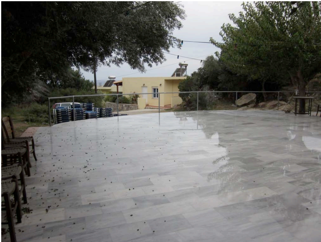
Die Tanzfläche unter den Oliven bei Regen im Oktober