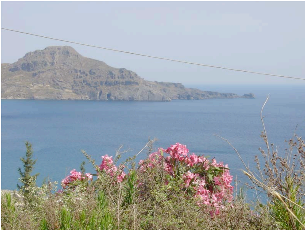
Blick auf das libysche Meer

Ob das eine kompetente Bewertung einer Tangoreise ist, weiß ich nicht, erstens, weil ich keinerlei Vergleiche habe und zweitens bin ich ganz bestimmt sehr voreingenommen, einfach, weil ich den Ort des Geschehens seit Jahren sehr liebe.