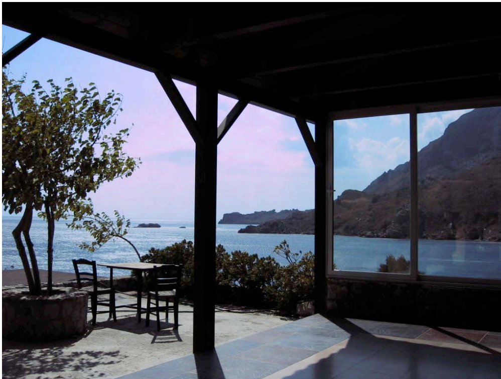
Blick von Stelios' Terrasse