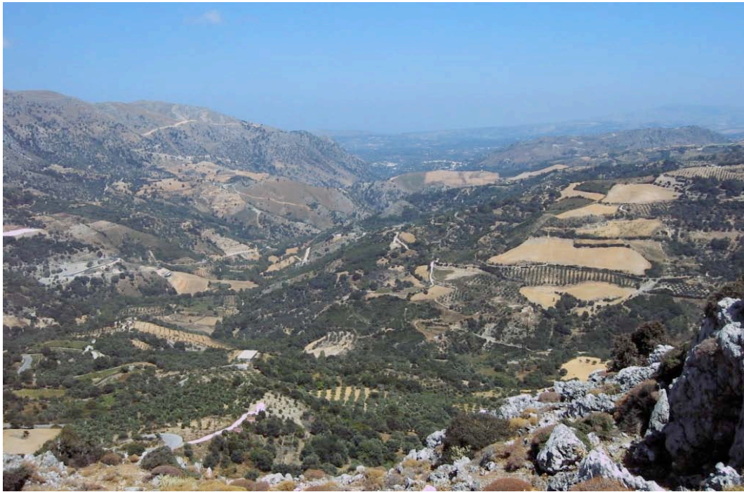
Blick vom Psiloritis

Gleichzeitig gibt es üppige grüne Hochtäler und auch fruchtbare Ebenen.