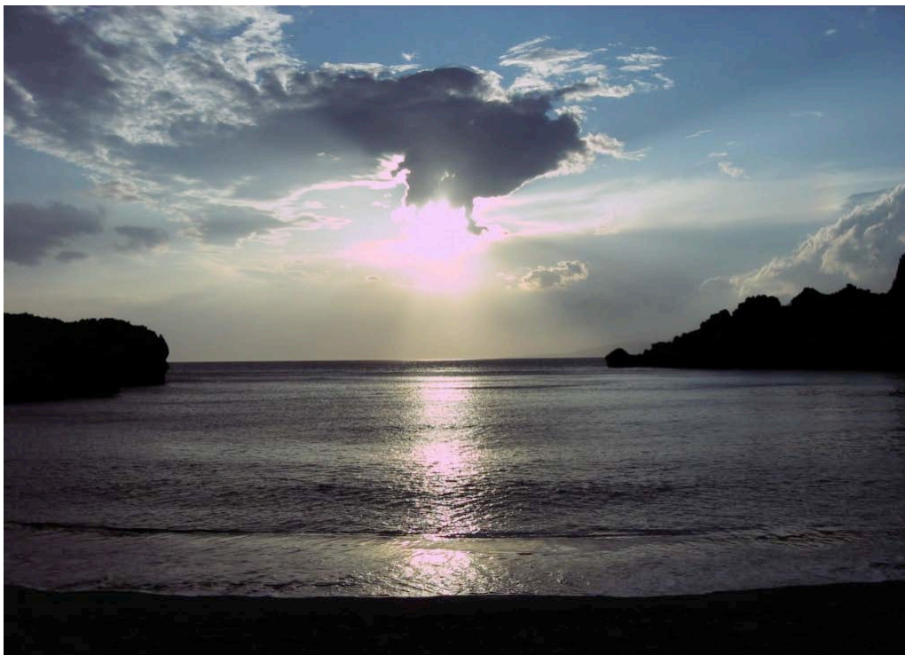
Abendstimmung am Strand