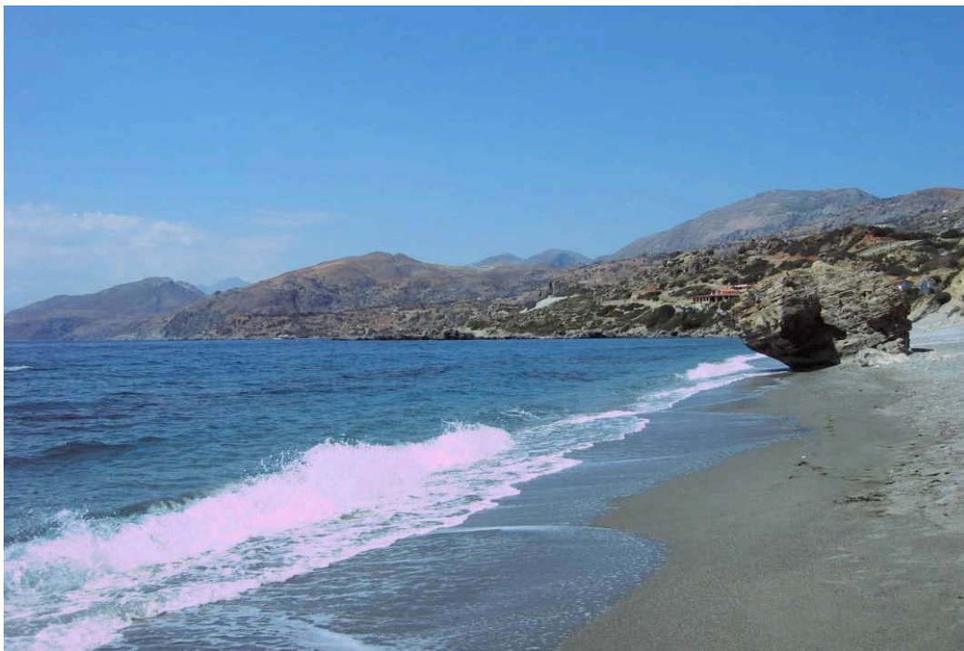
Der Strand von Ligres

Auf der Südseite der Insel ist der Zugang zum Meer oft schwierig, es gibt aber jede Menge kleine Buchten, oft ganz leer und mit schönem Sand.