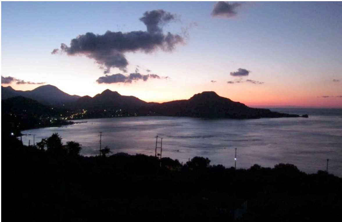
Sonnenaufgang über Plakias